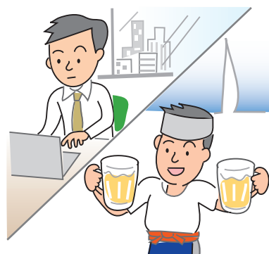
図1 「従たる給与についての扶養控除等の(異動)申告」の対象者

その形態も、正社員やパート・アルバイトだけではなく、会社役員や起業による自営業主など、様々あります。副業や兼業に関する裁判例では、労働者が労働時間以外の時間をどのように利用するかは、基本的に