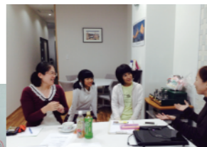
「無料パソコン使い方相談」愛知商工連盟1Fにて。お子さま連れで和気あかい。

ほぼ月一回、愛知商工連盟1Fで「パソコン使い方相談」を実施させていただきます。パソコン教室えむ&えむです。作のカシワギWEB製作所と