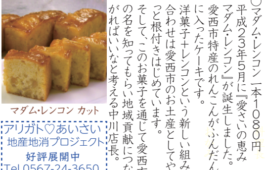
マダム・レンコン カット アリガト♡あいざい 地産地消プロジェクト 好評展開中 Tel.0567-24-3650