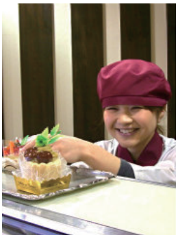
臨機応変さを課題と考えています。ヴァンドゥーズとして入立ちできるよう努力しています」と頼もしい。

2014年度新入社社員は若千20歳をこそのスタッフです。最初は積極性に欠けていたそうですが店長からの厳しい指摘や指導を素直に受け止め今ではなくてはならない存在になりました。 そのスタッフからの一言。「私は入社して約1年になりましたが、まだ不安なことが沢山あります。例えばお客様が選んだお好きな焼菓子を詰め合わせしてほしいという要望があると、それをどのようにとか、満足していただける形の提案とは、どうか状況に応じての