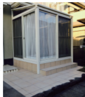
エクステリア デザイン&施工

一般家庭のお客様の中には、ご相談いただいたお客様の家族構成、ライフスタイルなど、ご家族の立場になり、様々な状況を考慮し、ご予算に合わせたベストな提案させて頂きます。またマンションやビルの大規模修繕の際には、オーナー様と綿密に打ち合わせを重ね、イメージを最大限に表現できるように全力でバックアップを致します。