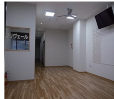
愛商連本部1階ロビー デザイン&施工

株式会社HIOKI 〒486-0821 愛知県 春日井市神領町3-6-9 電話 0120-40-1717 URL http://d-hioki.com