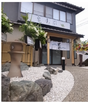
店舗例 デザイン&施工

5年後も『やつて良かった』と言われたらいいですね。これが私を悩ませ、社員一同の想いです。継続を力に変えていけるように努力をしていきます。