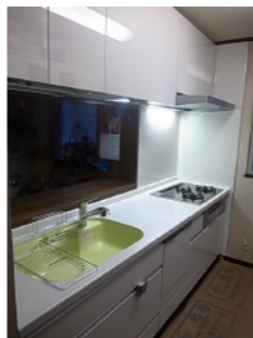
インテリアデザイン 水廻り

5年後も『やつて良かった』と言われたらいいですね。これが私を悩ませ、社員一同の想いです。継続を力に変えていけるように努力をしていきます。